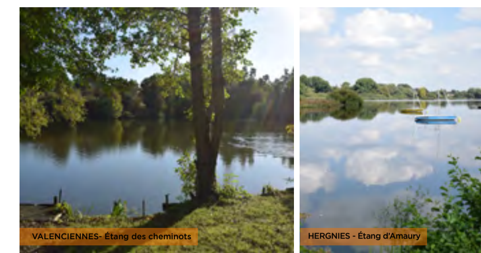
HERGNIES - Étang d'Amaury